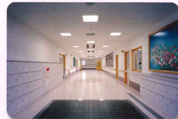
出会うの広場 玄関ホール