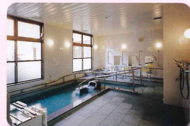
心身共リフレッシュする浴室