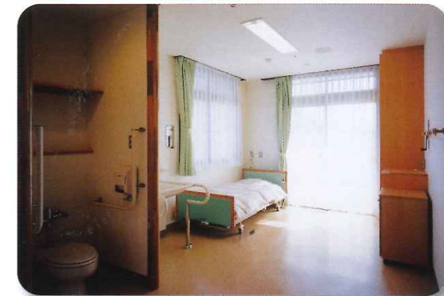
特養 80室(個室 50室、2人室 15室) ショートステイ 10室